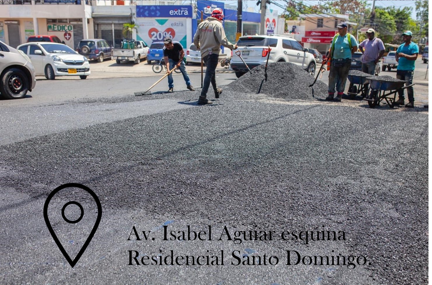
Av. Isabel Aguiar esquina Residencial Santo Domingo.