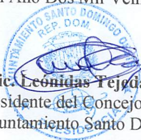
Lic. Leonidas Tejeda Presidente del Concejo de Regidores/as Ayuntamiento Santo Domingo Oeste.

Dado en la Sala de Sesiones del Honorable Ayuntamiento del Municipio Santo Domingo Oeste, Provincia Santo Domingo, a los Catorce (14) días del mes de Enero del Año Dos Mil Veintiuno (2021).